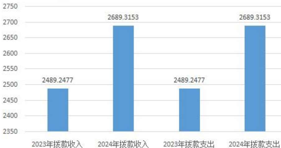
财政拨款收入、支出对比图（单位：万元）

本单位当年财政拨款收入2689.3153万元，其中一般共预算拨款收入2689.3153万元、政府性基金拨款收入0万元，较上年增加200.0676万元，主要原因是人员调入及2023年工资兑现普调后增加预算；本单位当年财政拨款支出2689.3153万元，其中一般公共预算拨款支出2689.3153万元、政府性基金拨款支出0万元，较上年增加200.0676万元，主要原因是人员调入6人及2023年工资兑现普调后增加预算。